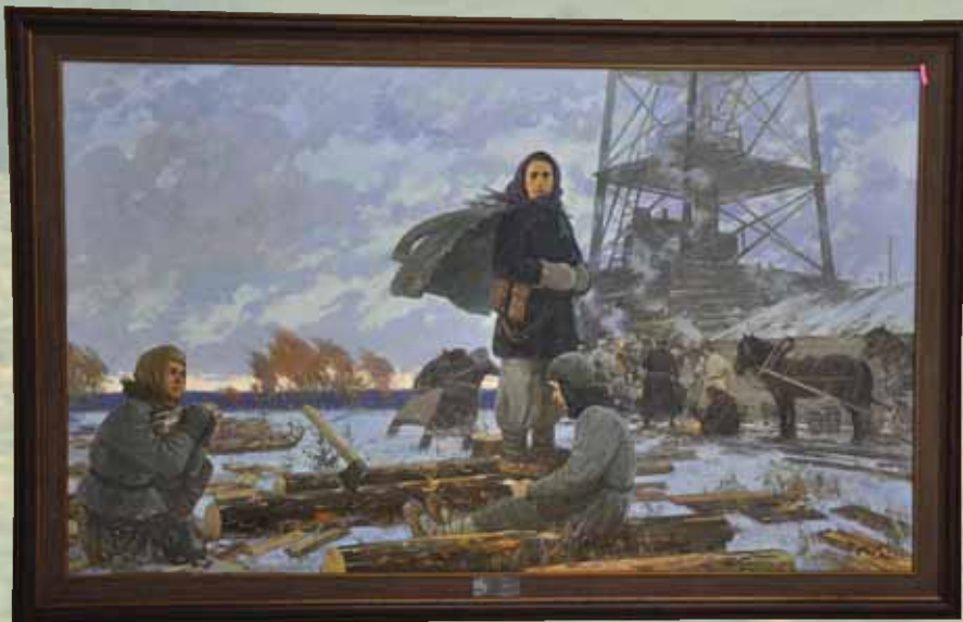
Р.Ф. Хузин «На тверди Ромашкинского месторождения»