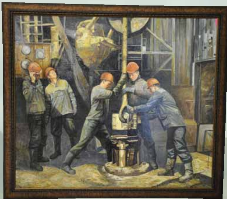
С.В. Царев «Нефтяники Татарстана»

Компания «Татнефть» предоставила возможность художникам вжиться в быт и деятельность нефтяников, посетить нефтяной регион, познакомиться с ветеранами и передовиками производства, пообщаться с героями.