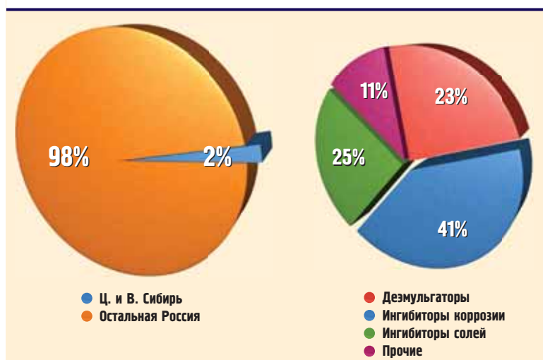
Потребление НПХ в Центральной и Восточной Сибири

тов и оказания сервиса и более эффективного взаимодействия с заказчиками и партнерами. И, конечно, опыт работы с крупнейшими нефтегазодобывающими предприятиями в России и за рубежом.