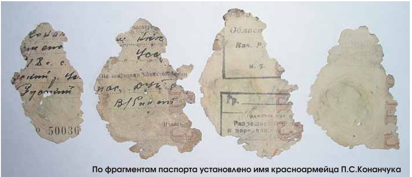
По фрагментам паспорта установлено имя красноармейца П.С.Конанчука