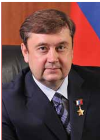
А.В. ШЕВЕЛЕВ Губернатор Тверской области