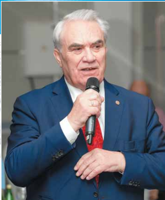
ИНТЕРВЬЮ ГЕНАДИЙ ШМАЛЬ Президент Союза нефтегазопромышленников России