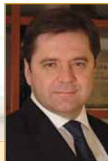
Министр энергетики Российской Федерации

От всей души желаю вам и вашим семьям доброго здоровья, счастья, благополучия и уверенности в завтрашнем дне!