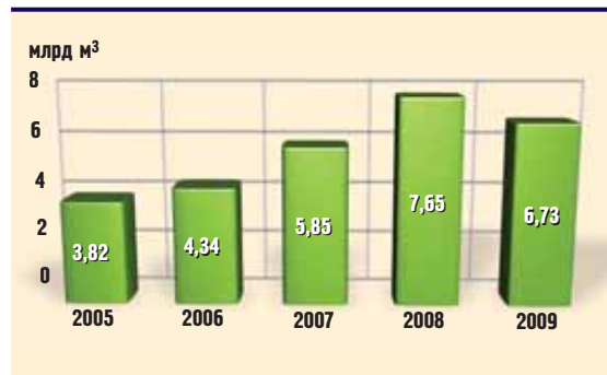
Добыча газа предприятиями ГНКАР

объемы добычи ГНКАР составили 3,82 млрд м 3 газа. Затем Газовая программа ГНКАР бодро набрала