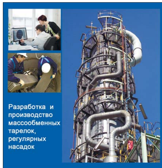
Разработка и производство массообменных тарелок, регулярных насадок

ванные специалисты и управленцы, во-первых, довольно редки, и их можно в прямом смысле пересчитать по пальцам, во-вторых, крайне редко кто-то из них находится «в свободном плавании».