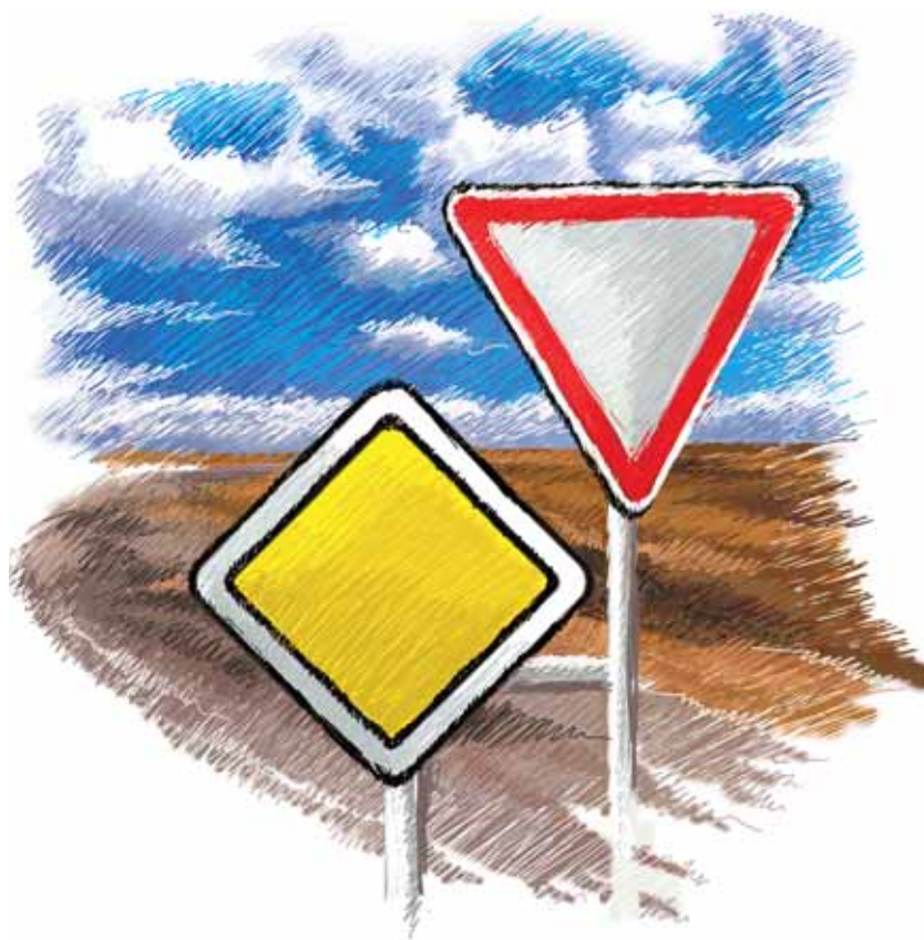
НАИБОЛЕЕ АКТИВНЫЕ НЕФТЕГАЗОВЫЕ КОМПАНИИ РОССИИ В 2011 ГОДУ (TOP-10 «Нефтегазовой Вертикали»)

Как справедливо заметил М.Субботин, есть два типа отличившихся компаний: «благодаря» и «вопреки». Благодаря государственной поддержке росла НОВАТЭК, «Газпром» и «Роснефть», вопреки — ЛУКОЙЛ и ТНК-ВР.