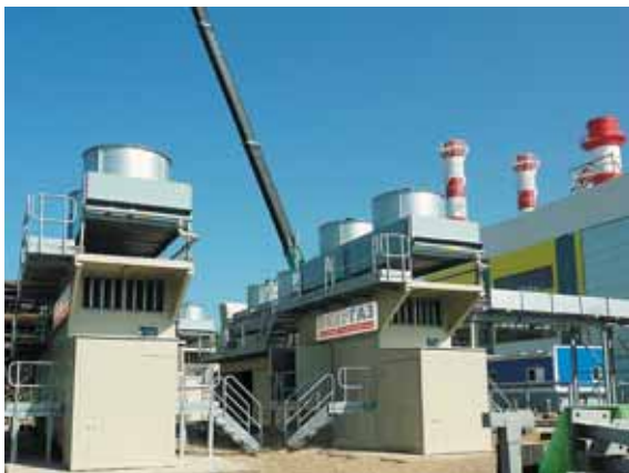
Фото 1. Двухступенчатые ДКУ обеспечивают топливом 4-й и 5-й энергоблоки Южно-Сахалинской ТЭЦ-1