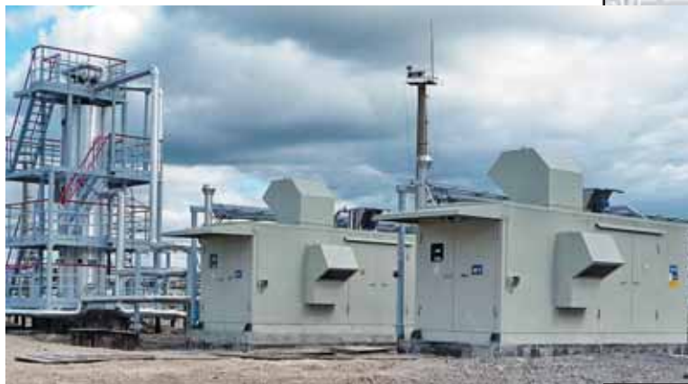
Фото 2. Компрессорные установки низкого давления на ЦППН НГДУ «Комсомольскнефть»

При необходимости установки оснащаются поршневыми компрессорами, которые обеспечивают более высокое выходное давление газа и могут функционировать с большей производительностью.