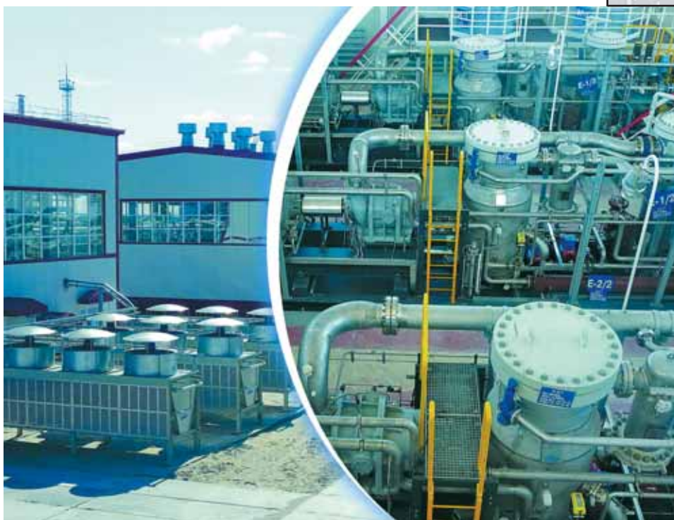
Фото 3. Дожимная компрессорная станция ангарного типа для ПЭС-36 Северо-Лабьютьюганского м/р

Помимо эксплуатационных технологических систем, установки оснащаются системами жизнеобеспечения (вентиляция, обогрев, освещение) и безопасности (газодетекция, пожаробезопасность и пожаротушение).