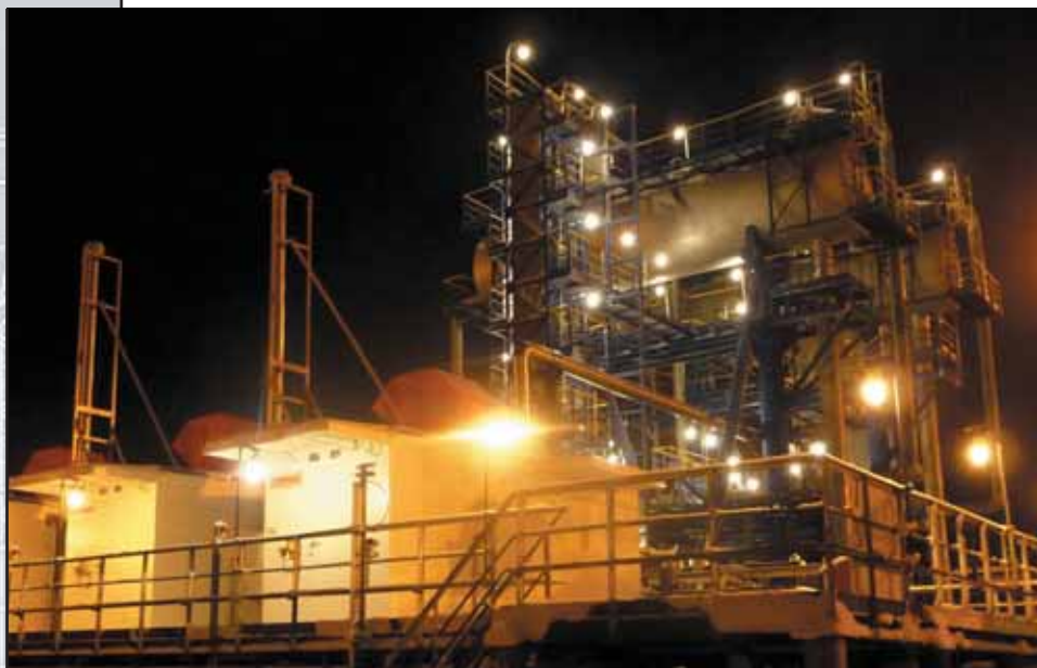
Фото 4. ДКУ от компании ЭНЕРГАЗ эксплуатируются в экстремальных условиях Крайнего Севера