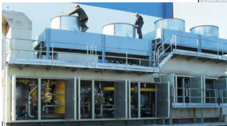
Фото 6. Монтаж аппарата воздушного охлаждения на компрессорную установку

При наличии особых проектных требований заказчика, ДКУ ЭНЕРГАЗ могут осуществ-