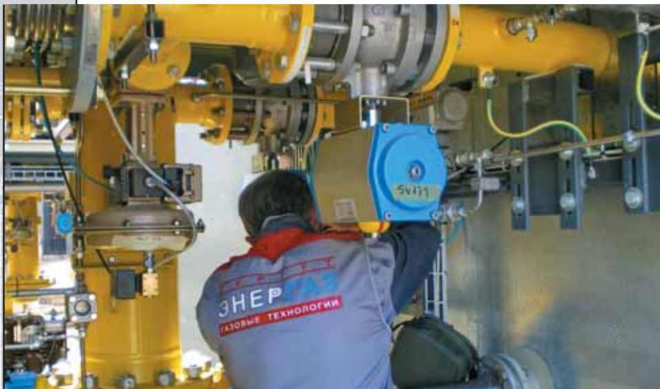
Фото 7. Своевременное ТО — залог надежности и эффективности оборудования

сается резервирования маслососов и насосов системы охлаждения. Причем переключение на резервные элементы осуществляется автоматически.