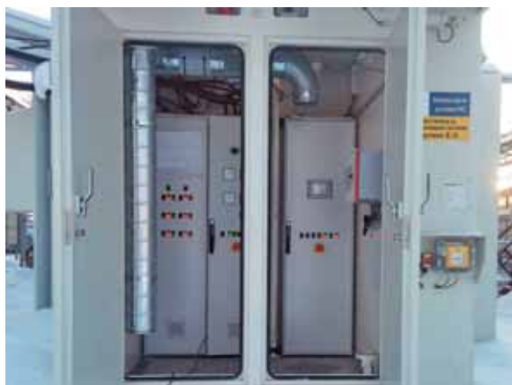
Фото 5. Отсек САУ расположен внутри блок-модуля компрессорной установки

среды. Такую проектную проблему способен решить производитель, обладающий инженерным опытом и знаниями в области поддержания температуры нагнетания газа.