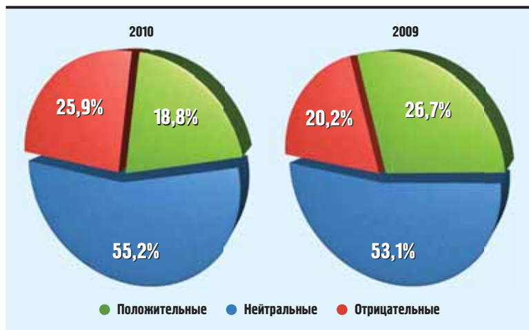
Распределение оценок в номинации «Власть»

Хочу отметить реальный успех Минприроды, начавшего гово-