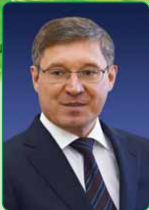
Губернатор Тюменской области Владимир Якушев