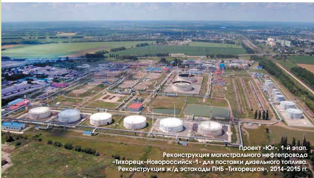
Проект «Юг», 1-й этап. Реконструкция магистрального нефтепровода «Тихорецк–Новороссийск-1» для поставки дизельного топлива. Реконструкция ж/д эстакады ПНБ «Тихорецкая», 2014–2015 гг.

Сегодня российские нефтегазовые компании продолжают входить в число крупнейших игроков на мировом рынке энергоресурсов. Вот уже на протяжении 25 лет ЗАО «ПИРС» тесно сотрудничает с ведущими компаниями отрасли, такими как ОАО «АК «Транснефть», ОАО «Газпром», ОАО «НК «Роснефть» и ОАО «ЛУКОЙЛ», оказывая им высококачественные услуги в области инженерных изысканий, проектирования, разработки информационных систем, а также осуществления авторского надзора и строительного контроля над объектами ТЭК.