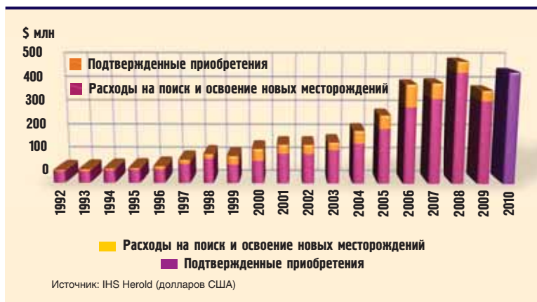
Общий объем расходов на разведку и добычу

транспортного топлива в развитых странах. Возможные изменения в политике в результате аварии на буровой платформе в Мексиканском заливе, а также ужесточение требований природоохранного законодательства могут стать причиной более активного перехода на использование альтернативных видов топлива.