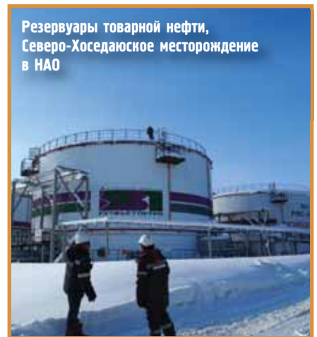
Резервуары товарной нефти, Северо-Хоседаюское месторождение в НАО

на ряде блоков Кубы. Летом этого года «Зарубежнефть» планирует приступить к бурению поисковой скважины на перспективном шельфовом блоке L.