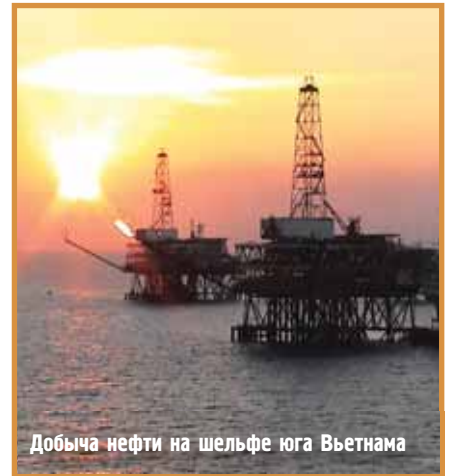
Добыча нефти на шельфе юга Вьетнама

Серьезным достижением компании стало возвращение в 2010 году на Кубу. С кубинской госкомпанией Subaretrole были подписаны контракты на проведение геологоразведочных работ и освоение нефтяных месторождений