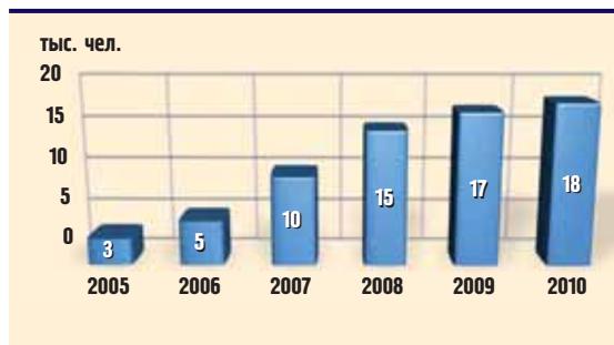
Количество участников спартакиад

Важным событием в жизни компании стала ежегодная многоэтапная корпоративная спартакиада. На первом ее этапе прово-