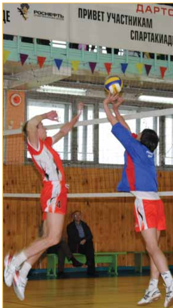
Расходы на финансирование соглашений о социально-экономическом сотрудничестве