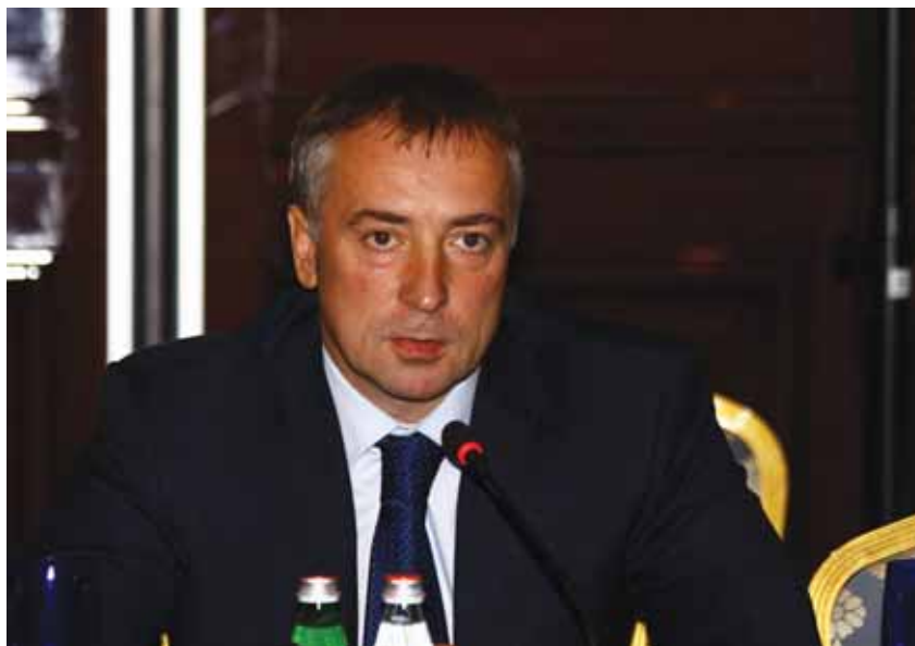
ВЛАДИМИР МАЗУР Заместитель губернатора Тюменской области

Такого рода меры позволяют нам выявлять те проблемы, которые возникают у поставщиков и у