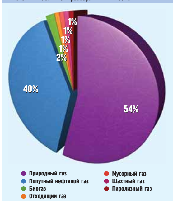
Рис. 3. Тип газа в компрессорах ENERPROJECT

4. Комплектация ДКУ. Высокую надежность и эффективность работы ДКУ обеспечивают вспомогательные системы (маслосистема, системы регулирования производительности, охлаждения, очистки газа, сепарации масла, оборудование КИПиА, вибромониторинг, системы пожаробезопасности и пожаротушения, система газообнаружения, АСУ, НКУ и др.). Поэтому удостоверьтесь не только в наличии всех систем, но и в соответствии их рабочих характеристик заданным параметрам эксплуатации.