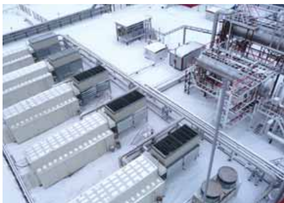
Фото 2. ДКУ в арктическом исполнении на АLEXИНСКОМ месторождении ОАО «Сургутнефтегаз»