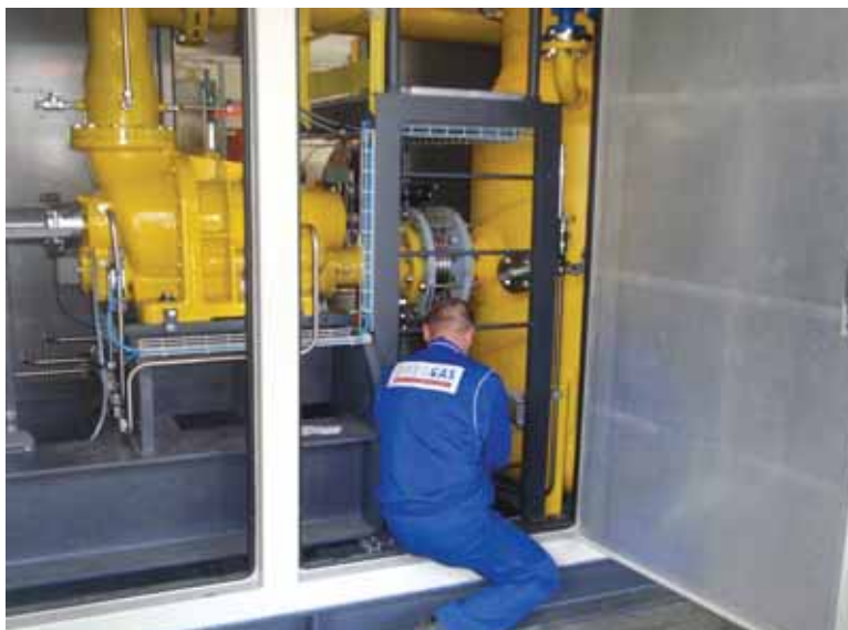
Фото 4. Сервисное обслуживание газодожимного оборудования Enerproject

Температура нагнетания газа. Температура подачи топливного газа может колебаться в широком диапазоне от +40 до +150 °С. Газы, которые в условиях нагнетания имеют высокую точку росы, яв-