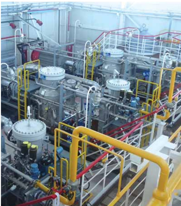
Фото 3. Дожимная компрессорная станция на открытой раме (ГТЭС-36 Северо-Лабатьюганского месторождения)