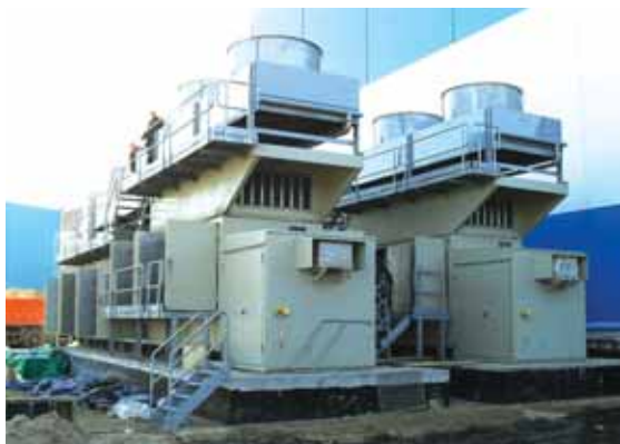
Фото 1. Блочно-модульные ДКУ Enerproject на ПГУ-115 Воронежской ТЭЦ «Квадра»

2. Параметры газа. В основном дожимные компрессорные установки работают с двумя ви-