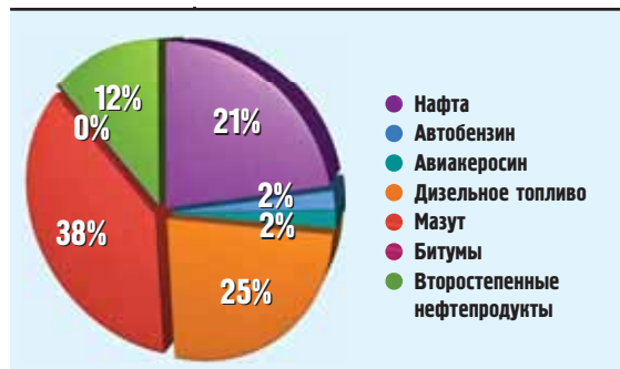
Структура производства нефтепродуктов на мини-НПЗ и средних НПЗ

производят в незначительных объемах, и эти продукты реализуются на внутреннем рынке (см. «Структура производства нефте-