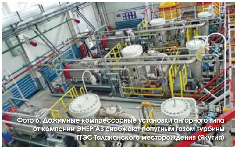
Фото 6. Дожимные компрессорные установки ангарного типа от компании ЭНЕРГАЗ снабжают попутным газом турбины ГТЭС Талаканского месторождения (Якутия)