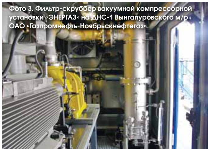
Фото 3. Фильтр-скруббер вакуумной компрессорной установки «ЭНЕРГАЗ» на ДНС-1 Вынгапуровского м/р ОАО «Газпромнефть-Ноябрьскнефтегаз»