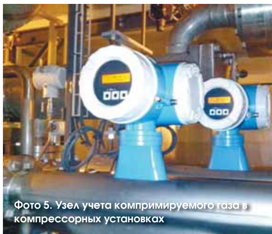
Фото 5. Узел учета компримируемого газа в компрессорных установках

Для обеспечения надежной работы КС разрабатываются специальные инженерные решения, исходящие из состава газа,