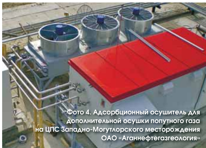
Фото 4. Адсорбционный осушитель для дополнительной осушки попутного газа на ЦПС Западно-Могутлорского месторождения ОАО «Аганнефтегазгеология»

нии шли на затраты крайне неохотно, а зачастую вынужденно устранялись от задачи рационального использования такого ПНГ.