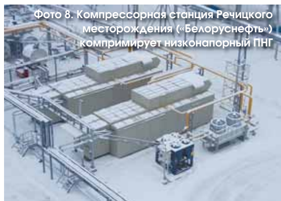
Фото 8. Компрессорная станция Речицкого месторождения («Белоруснефть») компримирует низконапорный ПНГ

екте — в силу истощения запасов углеводородов, обводненности скважин и т.д. Чтобы контролировать этот процесс (и затем при необходимости варьировать эксплуатационные характеристики КУ), компрессорные установки могут оснащаться следующим дополнительным оборудованием: