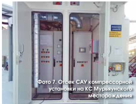
Фото 7. Отсек САУ компрессорной установки на КС Мурьянского месторождения

*Изменение характеристик исходного газа. По условиям некоторых проектов компрессорные установки компримируют смешанный попутный газ, поступающий с разных объектов добывающего комплекса. Соответственно, основные его параметры (состав, плотность, температура точки росы, теплотворная способность) могут меняться. Параметры исходного газа изменяются и при длительной добыче на одном объ-