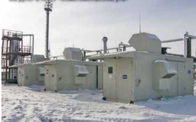
Фото 9. Газодожимное оборудование низкого давления на ДНС-2 НГДУ «Комсомольскнефть»