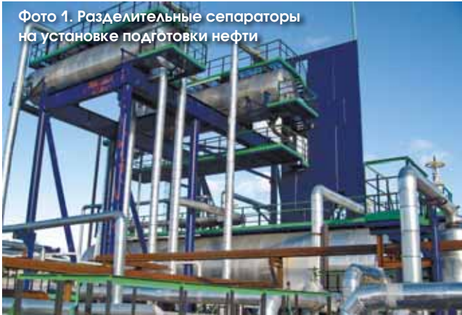
Фото 1. Разделительные сепараторы на установке подготовки нефти