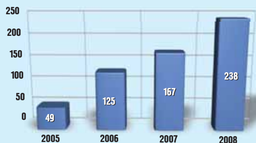
Динамика изменения численности персонала Управления по бурению ООО НПП «Буринтех»

С расширением применения PDC-долот работа по сопровождению долот постоянно подтверждала свою актуальность. Так в 2005 году на Приобском месторождении благодаря долотному сервису произошло резкое улучшение по-