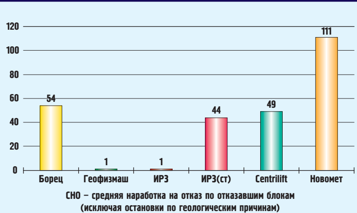
Текущая наработка ТМС по заводам-изготовителям

щиты по загрузке и недогрузу не защищают установку от перегрева, защита по ТМС обеспечивает отключение установки.