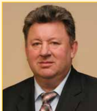
В.Кашин Председатель Комитета Госдумы РФ по природным ресурсам, природопользованию и экологии